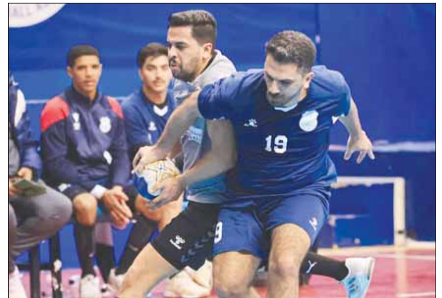
جانب من "تنشيطية" الموسم الماضي