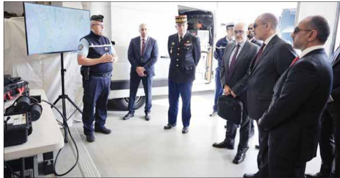
النائب الأول أثناء زيارته مقر قيادة المنطقة الجنوبية الشرقية التابعة لقوات الدرك الوطني الفرنسي

وأضاف أن الجانبين شددوا على أهمية استمرار التنسيق وتبادل المعلومات بشكل مستمر بما يضمن سرعة الاستجابة لمختلف التهديدات الأمنية وحماية المصالح المشتركة على المستويين الإقليمي والدولي.