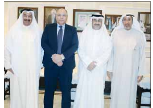
الشيخ عبدالله السالم والسفير المصري محمد أبو الوفا