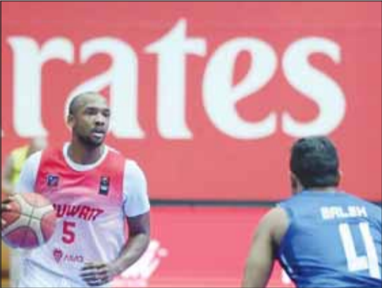
بطل العرب يستهل السوبر بقاء القرنين