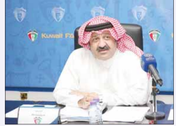
الشيخ أحمد اليوسف

ووضع اتحاد الكرة برنامجاً مكثفاً للأزرق أثناء فترة التوقف الدولي في شهر نوفمبر المقبل، حيث سيغادر إلى العاصمة المصرية القاهرة يوم 10 نوفمبر، لانتظام في معسكر يمتد حتى 20 من الشهر ذاته، على أن يخوض وديتين أمام تنزانيا وغامبيا يومي 14 و18 تواليًا، قبل أن يغادر القاهرة إلى العاصمة القطرية الدوحة، تمهيداً لمواجهة موريتانيا في 25 من الشهر ذاته، في ملحق بطولة كأس العرب.