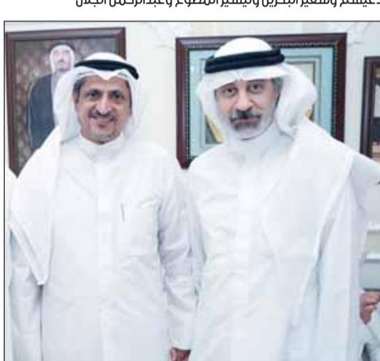
عماد السيف والشيخ مالك الصباح