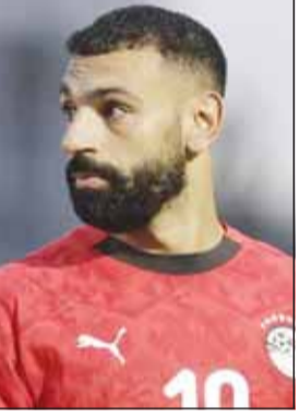
مدرب الفراعنة قرر إراحة صلاح

حسم الجهاز الفني لمنتخب مصر، بقيادة حسام حسن، رسمياً موقف محمد صلاح نجم ليفربول الإنجليزي، من خوض لقاء غينيا بيساو المقرر لها اليوم على استاد القاهرة الدولي، ضمن منافسات الجولة العاشرة والأخيرة من التصفيات الإفريقية المؤهلة إلى كأس العالم 2026.