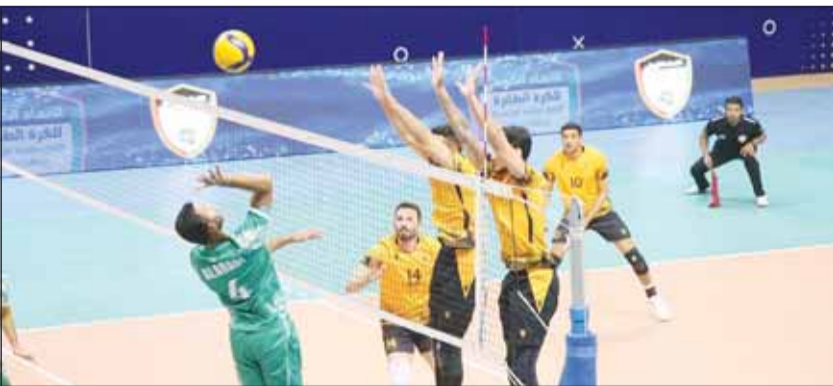
"طائرة" القادسية هزم العربي