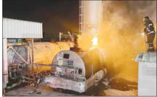
النار مشتعلة فيه خزان يحتوي على مادة سريعة الاشتعال

سيطرت فرق إطفاء مركزي الصليبخات والاستقلال فجر أمس السبت على حريق مصنع خرسانة بمنطقة الشدادية. وذكرت قوة الإطفاء في بيان لها أنه وعند وصول الفرق تبين أن الحريق شب في خزان يحمل مادة "البيجوتين" سريعة الاشتعال، مضيفة أنه تمت مكافحة الحريق والسيطرة عليه دون وقوع أي إصابات تذكر.