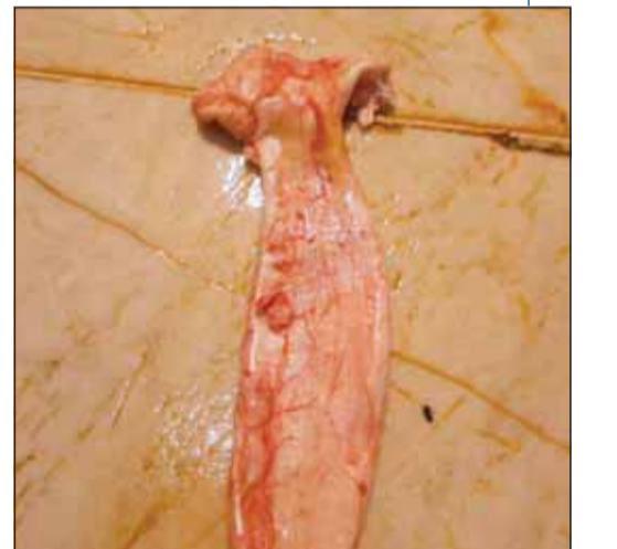
المثانة الهوائية للسمكة... سر السعر المرتفع

■ إنتاج كيلو غرام واحد من المثانة الهوائية يتطلب 33 كيلو من السمك