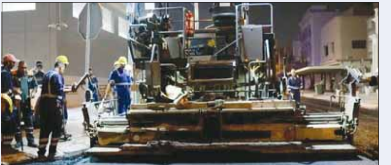
أعمال الصيانة تجري علم قدم وساق فيح "الفيحاء"