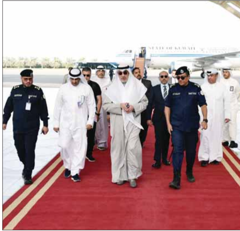
... وولده عودته إلى البلاد في ختام زيارة الولايات المتحدة وفرنسا

تنسيق مستمر وتبادل معلومات مع "الشرطة الدولية" لضمان سرعة الاستجابة للتهديدات الأمنية