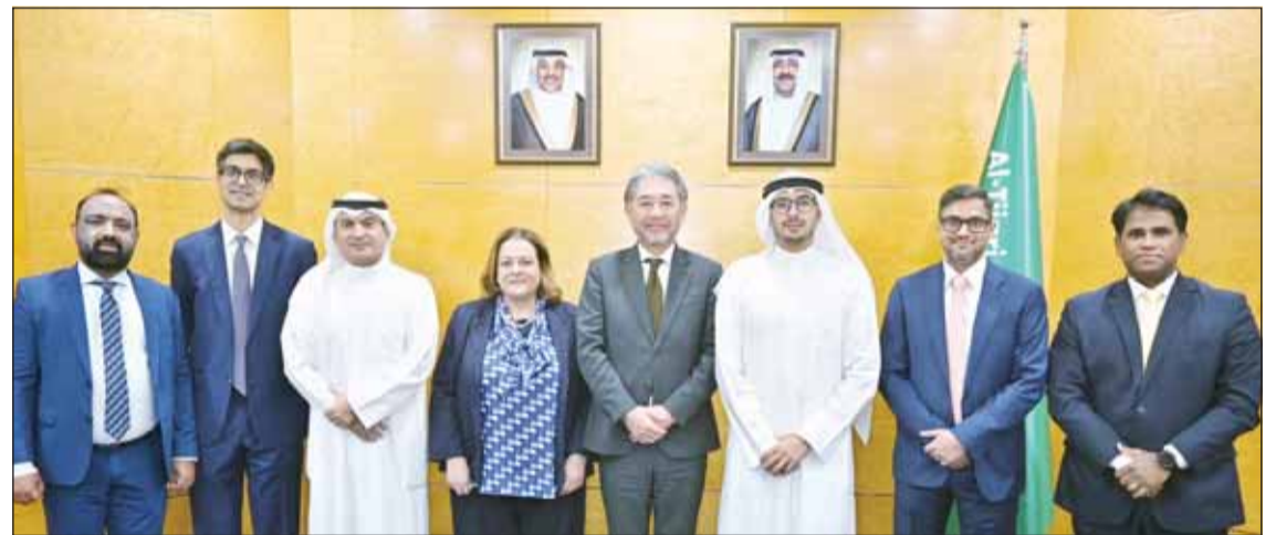
صورة جماعية على هامش توقيع الصفقة

أعلن البنك التجاري الكويتي، أحد المؤسسات المالية العريقة في الكويت عن حصوله على تمويل آسيوي مشترك بقيمة 500 مليون دولار لمدة خمس سنوات، حيث تولى بنك "ميزوهو" منفرداً مهام تنظيم وإدارة وترتيب الصفقة. وقد حققت الصفقة نجاحاً كبيراً، حيث بلغ حجم الطلب على الاكتتاب 1,9 مرة، مع مشاركة 23 مستثمراً آسيوياً من 8 دول آسيوية في الصفقة التمويلية. وتعليقاً على الصفقة، عبر الشيخ أحمد دعيج الصباح، رئيس مجلس إدارة البنك التجاري الكويتي، عن سعادته قائلاً: "تمثل هذه الصفقة إنجازاً كبيراً للبنك التجاري الكويتي، حيث تساهم في تنوع قاعدة ومصادر التمويل وتؤسس لعلاقة عمل قوية مع مجموعة رائدة ومتنوعة من المستثمرين في آسيا. وسوف نوجه هذا التمويل لتعزيز مبادراتنا الاستراتيجية بغرض تحقيق النمو، مما سيسود في النهاية بالنفع على عملائنا وعلى البنك والاقتصاد الكويتي بشكل أكبر". وأضاف أنه سيتم استخدام حصيلة الصفقة في الأغراض التجارية والموسمية العامة للبنك وتعزيز مركزه المالي، ودعم استثمارية الاستثمار في التكنولوجيا والحلول المرتكزة على تقديم أفضل