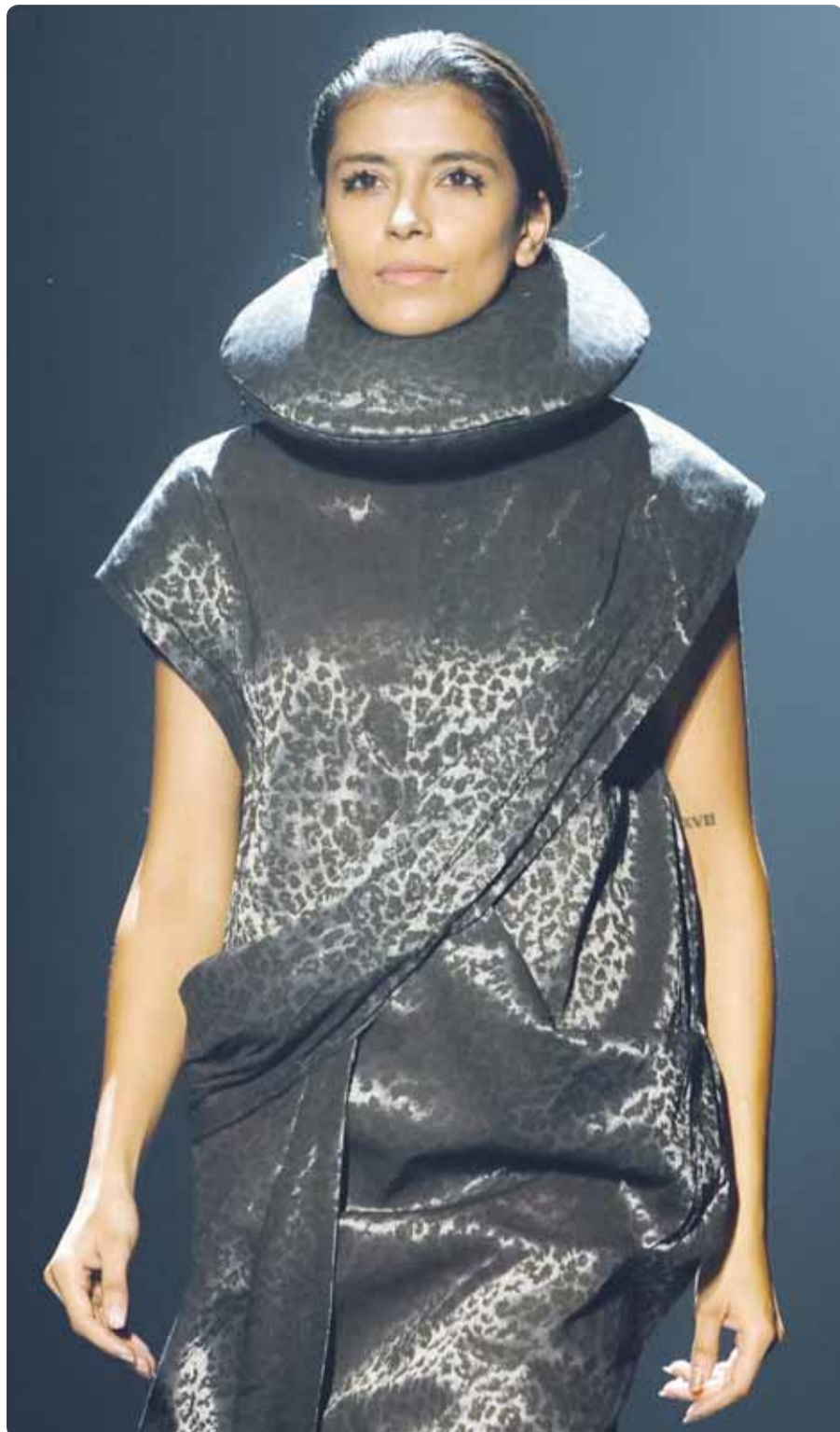
عارضة فني زي من مجموعة "INCA" خلال أسبوع نيودلهي للموضة (اب)