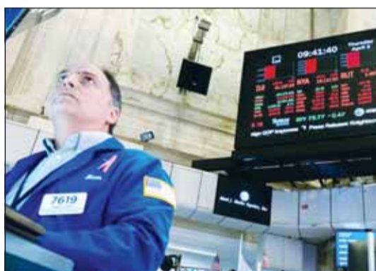
انهباءر جديد في هول ستريت

في الرسوم الجمركية على السلع الصينية. وأضاف "من غير الممكن أن يُسمح للصين باحتجاز العالم، وشهدت أسهم شركات التكنولوجيا العملاقة يوم الجمعة تراجعاً حاداً أقدّمها نحو 770 مليار دولار من قيمتها السوقية، بعدما هوت أسهم إنفيديا وأمازون وتسلأ بنحو 5٪ منها، مما دفع مؤشر ناسداك للهبوط بنسبة 3,6٪، في أسوأ أداء له منذ أبريل الماضي.