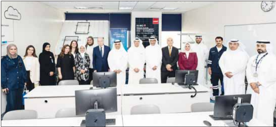
قيادات الجامعة الأسترالية و"لايف إنرجي" خلال حفل افتتاح مختبر الطاقة الشمسية الجديد

وزارة الكهرباء والماء والطاقة المتجددة. ويمثل افتتاح المختبر انطلاقة لشراكة استراتيجية طويلة الأمد بين الجامعة الأسترالية وشركة "لايف إنرجي"، ويمهد الطريق لتعاون مستقبلي مع مؤسسات رائدة في القطاعين الأكاديمي والصناعي والمساهمة في تحقيق أهداف الكويت نحو مستقبل أكثر استدامة.