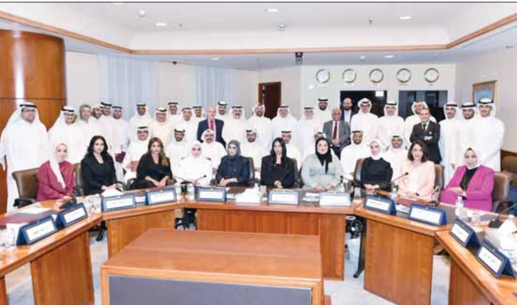
صورة جماعية للخريجين