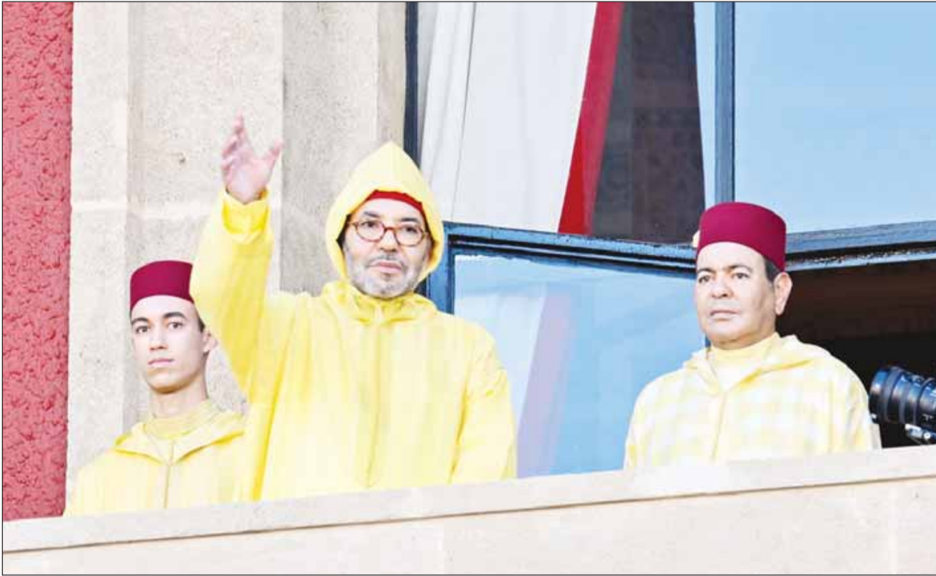
العاهل المغربي الملك محمد السادس مفتتحا الدورة الأولى من السنة التشريعية الخامسة من الولاية التشريعية الحادية عشرة للبرلمان بحضور ولي العهد الأمير الحسن والأمير رشيد (مواضع)

وشدد على ضرورة إعطاء الأولوية لتحقيق العدالة الاجتماعية والمجالية، من خلال تسريع وتيرة برامج التنمية الترابية، وتوجيه الجهود نحو تنمية المناطق الجبلية والهشة، وتوسيع المراكز القروية، وتفعيل آليات التنمية المستدامة للمساكن، موجها إلى تعبئة شاملة لكل الطاقات، من حكومة وبرلمان وأحزاب ومجتمع مدني، للرفع من نجاعة الاستثمار العمومي وتحقيق الأثر الملموس على حياة المواطنين، مشددا على أن خدمة الوطن تتطلب النزاهة والالتزام ونكران الذات، داعيا البرلمانين إلى مواصلة العمل بروح المسؤولية والالتزام لاستكمال الأوراش التشريعية وتنفيذ البرامج المقترحة، كما أشاد بالدور الحيوي الذي يقوم به البرلمان في التشريع ومراقبة العمل الحكومي، مؤكدا أهمية التعاون بين البيروماتسيات البرلمانية والرسمية لنهضة القضايا العليا للوطن. وقال "لقد دعونا في خطاب العرش الأخير، إلى تسريع مسيرة المغرب الصاعد، وإطلاق جيل