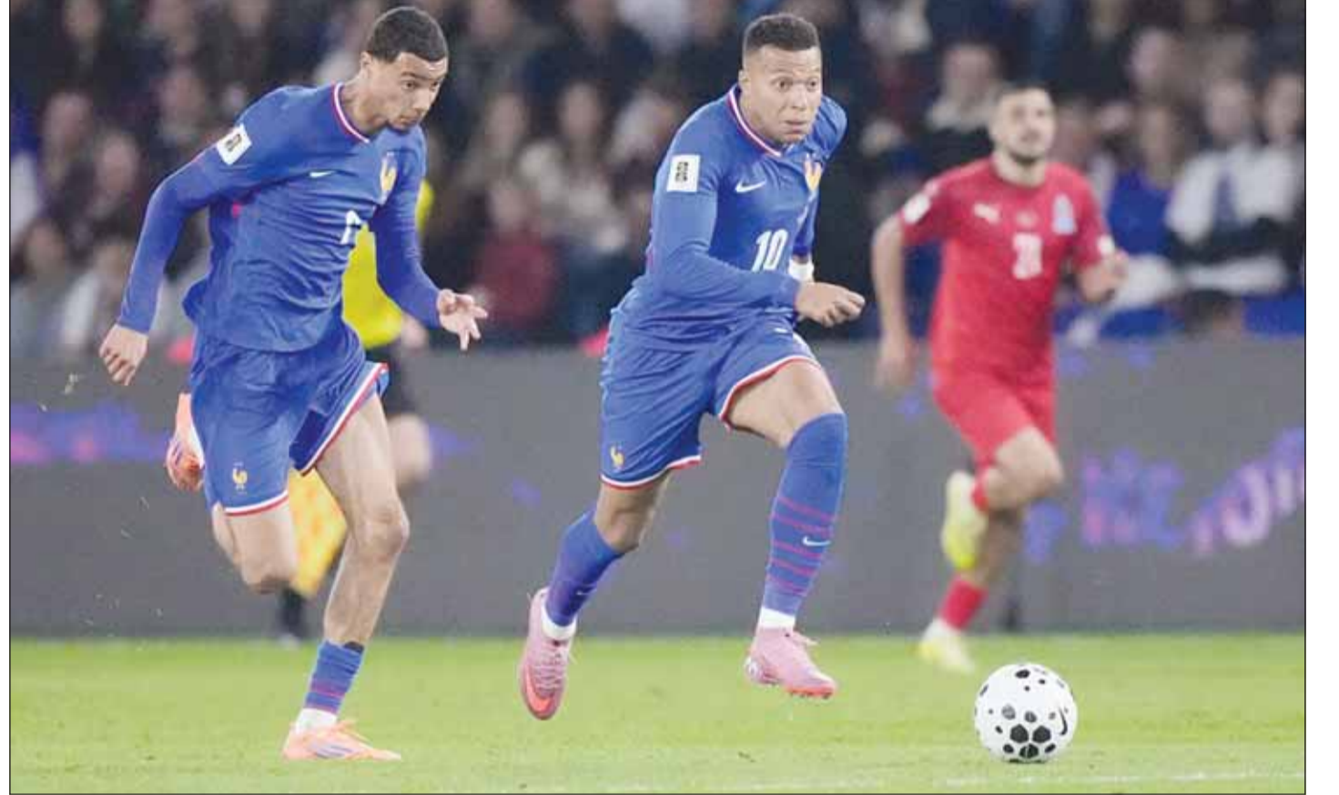
مباراة قاد الديوك إلى الفوز على أذربيجان

بلا رصيد من النقاط بعد تلقيه الهزيمة الثالثة على التوالي، فيما فشلت بلجيكا في اقتناص الصدارة بعد تعادلها مع ضيفتها المتصدرة مقدونيا الشمالية ضمن الجولة السادسة للمجموعة العاشرة.