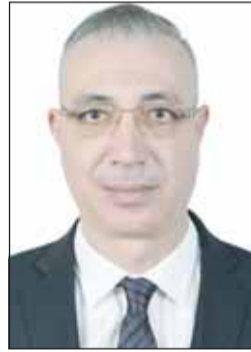
نديم عز الدين